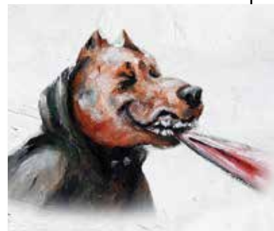
Soucieux d'éviter toute stigmatisation, l'illustrateur a choisi de présenter le harceleur sous les traits d'un Pitbull, un molosse bien connu pour ne jamais lâcher prise... et il a imagé les autres personnages avec des têtes d'autres chiens.