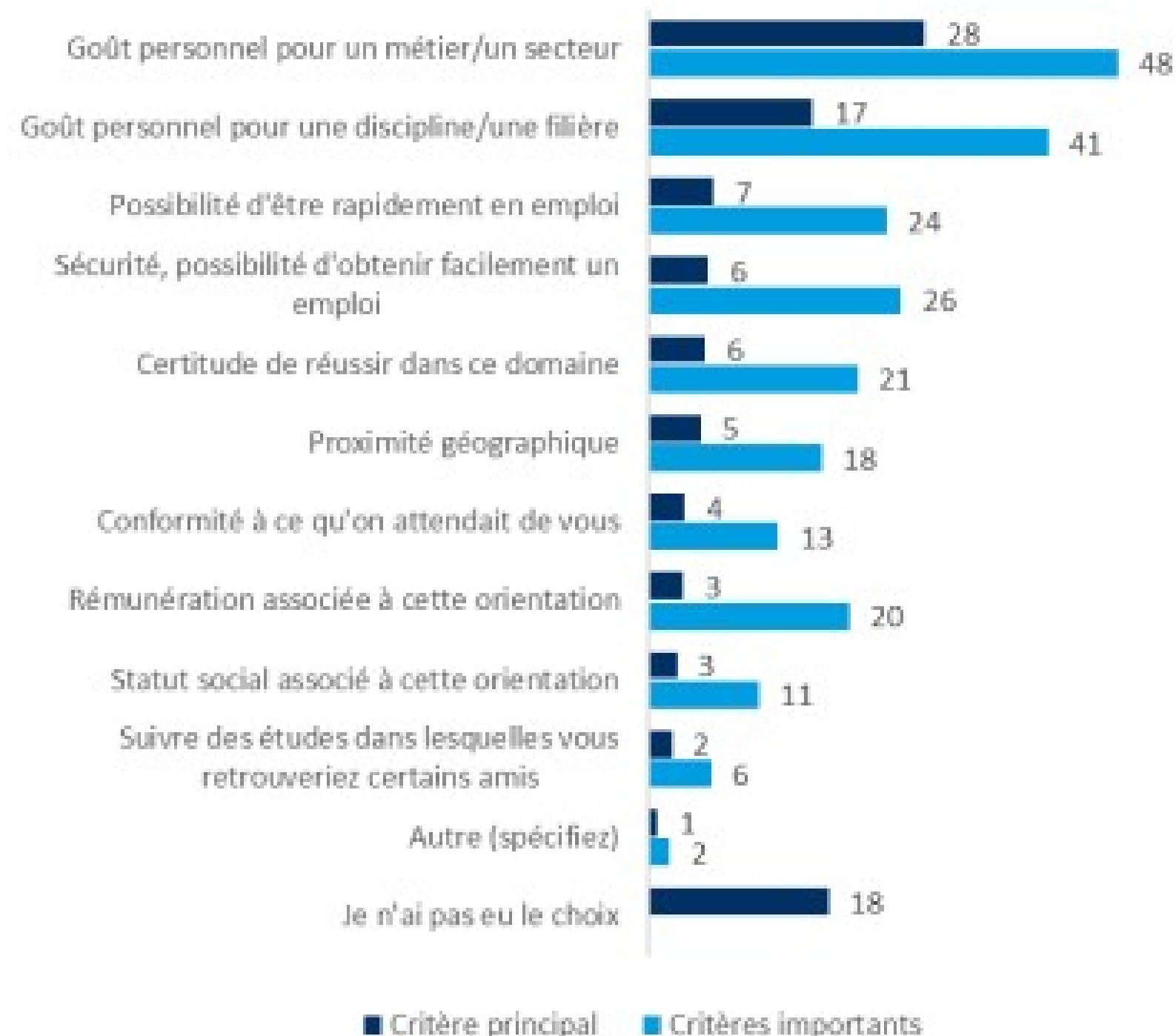
Figure 3 : Les goûts personnels en tête des motivations, suivis par le souci de sécurité Quel a été le critère le plus important dans le choix de votre orientation ? Quels ont été les autres critères importants ? (en %)

Source : CRÉDOC pour le Cnesco, enquête auprès des 18-25 ans, septembre 2018